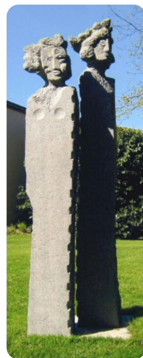
« Couple »