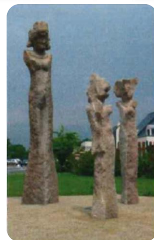
« La Petite famille »