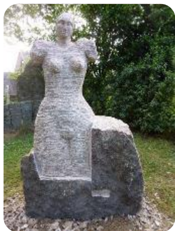
« L'attente » de Florence Jarrige

L'an dernier 2 artistes sculpteurs ont été accueillis lors du symposium : Florence Jarrige et Louis Beauvais. A l'issue de cette manifestation 2 œuvres en sont sorties : « L'attente » créée par Florence Jarrige est toujours visible au parc-musée du granit, tandis que « Eklosion » de Louis Beauvais est quant à elle visible sur la commune de Juvigny-le-Tertre.