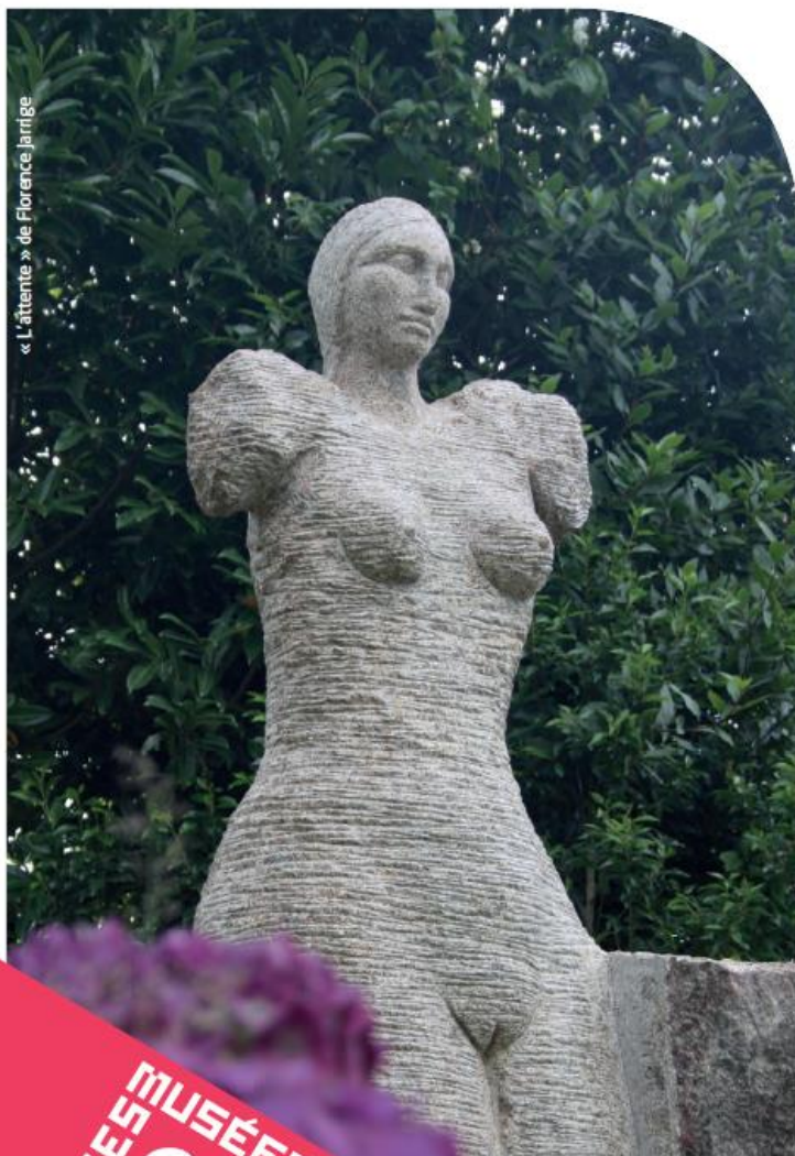
« L'attente » de Florence Jarrige

du lundi 6 juillet au vendredi 17 juillet 2015