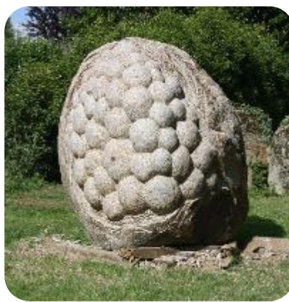
« Eklosion » de Louis Beauvais