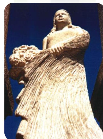
Monument du souvenir